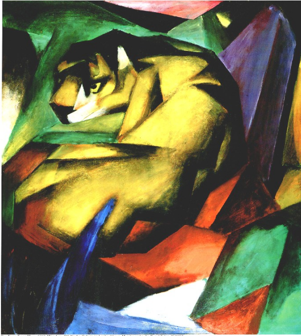
Der Engel, Franz Marc, 1912, München: Städtische Galerie im Lenbachhaus, Meisterwerke der Kunst Folge ©1997

Dir liegt eine Reproduktion eines Gemäldes des Expressionismus vor.