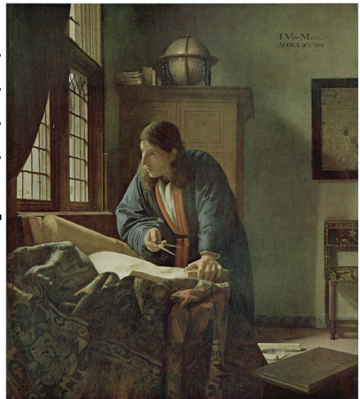
Ein Geograph oder Astronom in seinem Arbeitszimmer, Jan Vermeer van Delft (Jan van der Meer), 1658, Frankfurt, Städtisches Kunstmuseum, Meisterwerke der Kunst Folge 191302